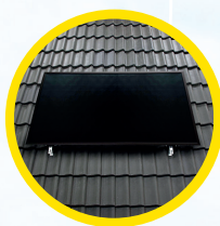
Opdak (horz. / vert.)